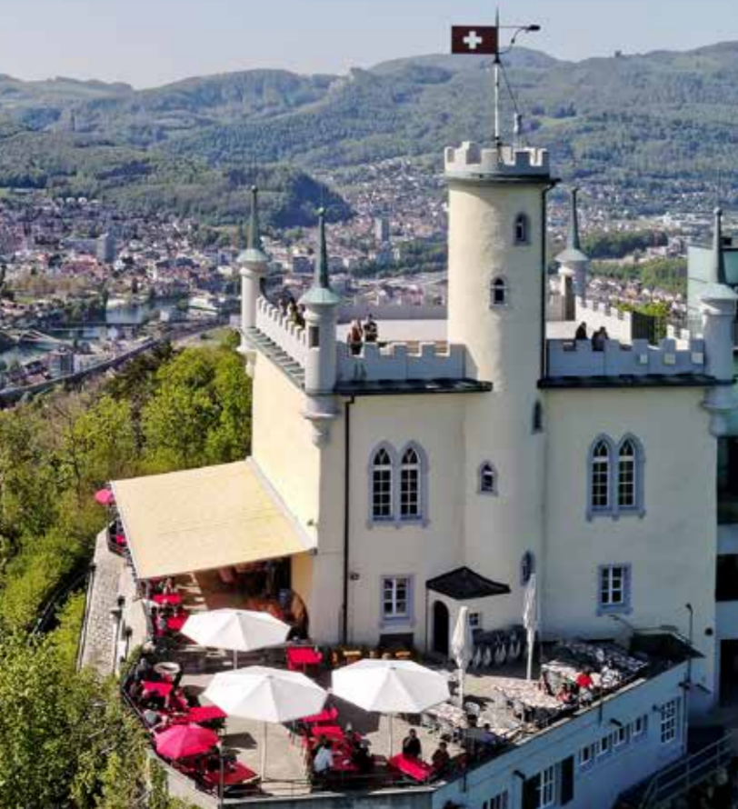
Prächtige 360° Panorama-Aussicht vom Sali-Schlössli, Olten.